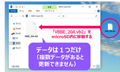
※パソコンでのデータコピーのイメージ (Windows版)